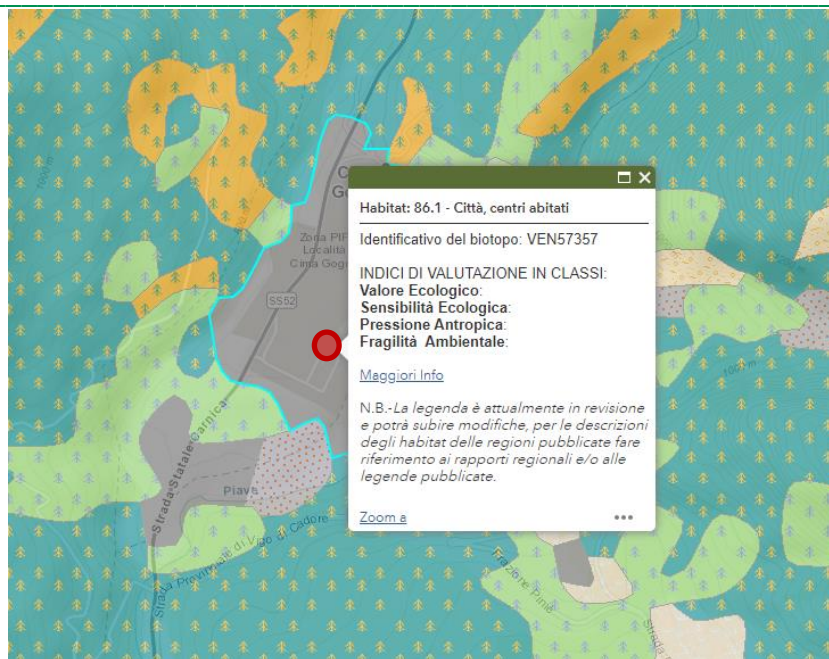
Fig. 5 - Estratto Carta della Natura area impianto– Ispra

Nei pressi dell'area di intervento sono presenti due Habitat ad elevato valore ecologico (Habitat 42.222 Peccete Montane Calcifile, Habitat 42.54 Pineta orientale di Pino Silvestre, Habitat 61.23 Ghiaioni basici alpini del piano altimontano e subalpino).