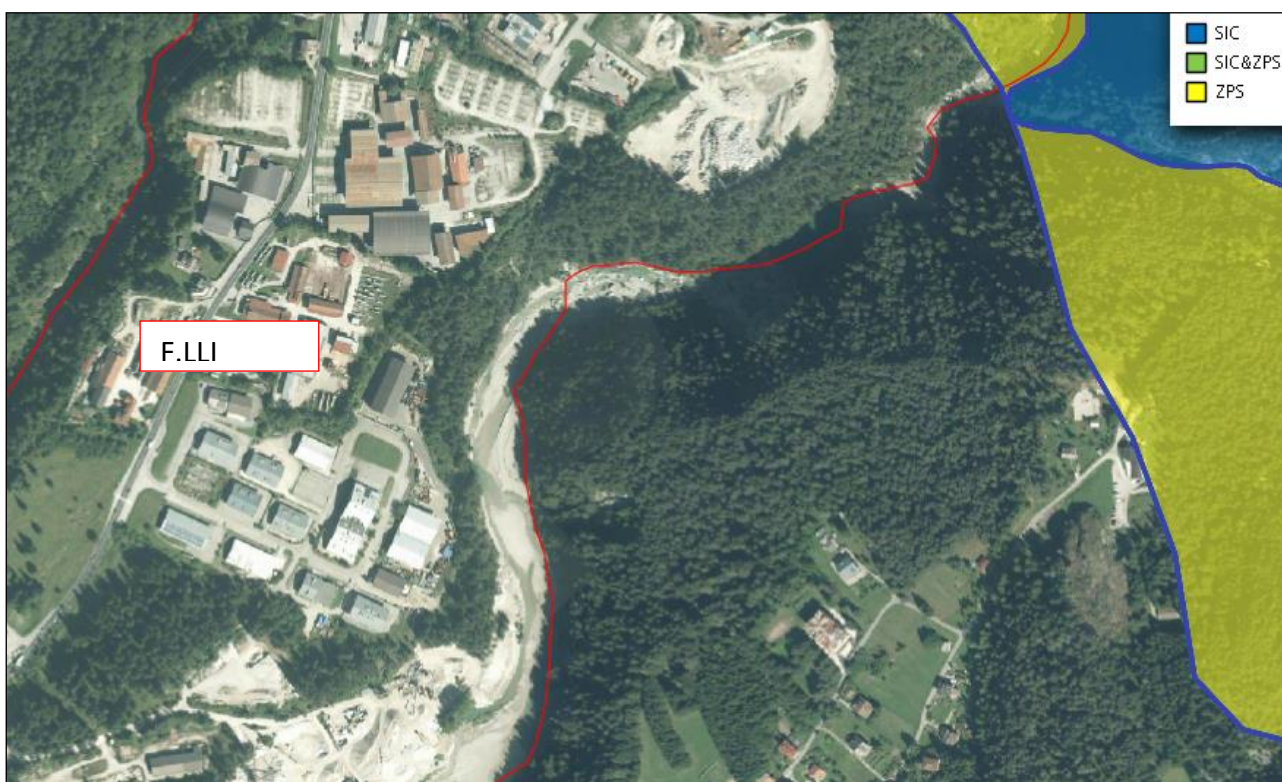
Fig. 5 - Estratto da Geoportale dati Territoriali Regione Veneto con area di intervento e SIC/ZPS più prossime al lotto

Rete Natura 2000 è una rete di siti di interesse comunitario (SIC), e di zone di protezione speciale (ZPS) creata dall'Unione europea per la protezione e la conservazione degli habitat e delle specie, animali e vegetali, identificati come prioritari dagli Stati membri dell'Unione europea. La figura 4 mostra le aree individuate dalla Rete Natura 2000 più prossime all'intervento, ovvero SIC IT3230085 "Comelico - Bosco della Digola - Brentoni – Tudaio" e ZPS IT3230089 "Dolomiti del Cadore e del Comelico") distanti circa 600 mt dall'impianto.